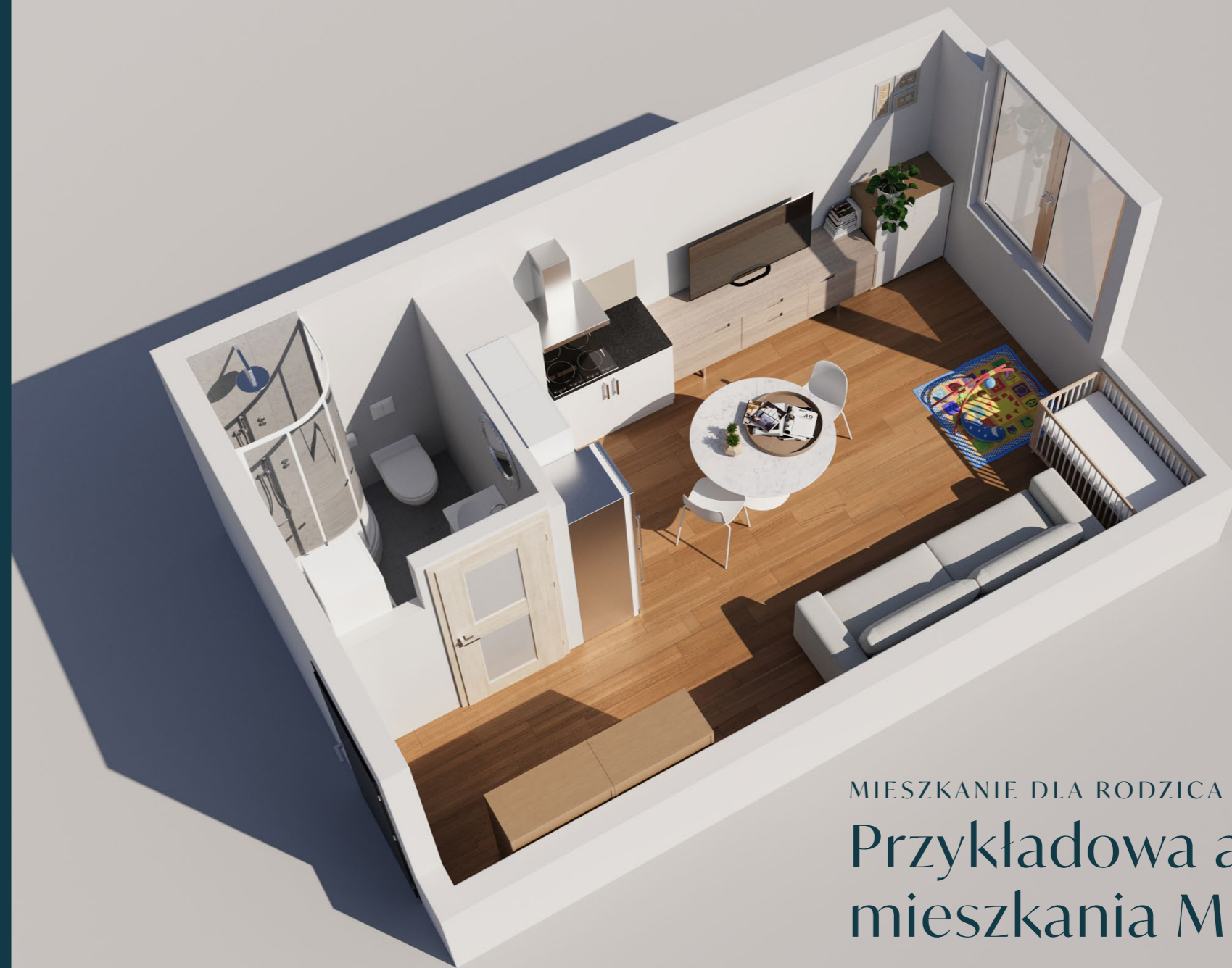
MIESZKANIE DLA RODZICA Z DZIECKIEM Przykładowa aranżacja mieszkania M 1.6B