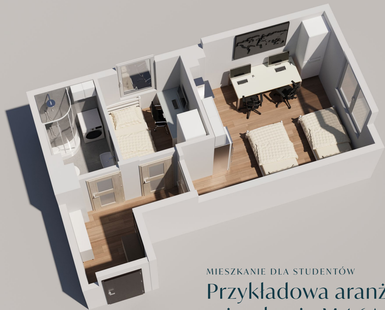
MIESZKANIE DLA STUDENTÓW Przykładowa aranżacja mieszkania M 1.6A